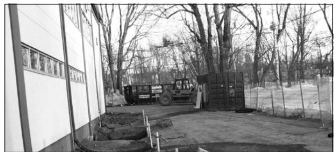
Aperçu du chantier, 17 avril 2008.

La campagne de financement 2007 a rapporté très exactement 9 823,26 $. Merci à tous et à toutes !