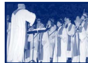
Gospel Célébration de Québec