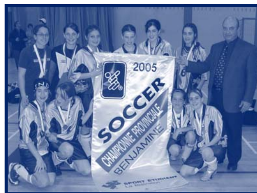
Championnats provinciaux de soccer Avril 2005