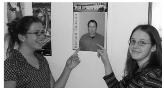
Soirée de retrouvailles, 26 octobre 2002